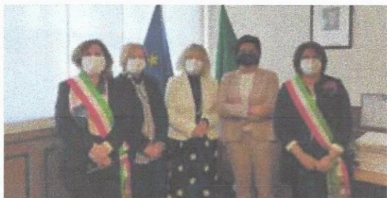
Un momento dell'incontro con il sottosegretario Gava

G iù le mani dalle gestioni comunali dei servizi idrici. L'Anpci, in coordinamento con i sindaci del Mezzogiorno, chiede al governo di confermare il passo indietro rispetto all'ipotesi di cancellare le gestioni dirette da parte dei sindaci. Gestioni che proseguono da 15 anni in circa 1.500 comuni italiani. Nelle ultime bozze del decreto semplificazioni la discussa norma che punta a cancellare le gestioni dirette comunali dei servizi idrici (previste dall'art. 147, comma 2 bis, lett. b del dlgs 152/2006), disponendo la loro confluenza nella gestione unica entro un anno, non compare più. Ed è un fatto positivo che tuttavia non deve indurre ad abbassare la guardia perché potrebbe rientrare in altri provvedimenti del governo.